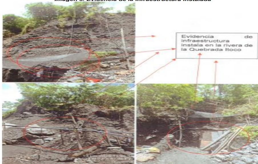
Imagen 3. Evidencia de la infraestructura instalada