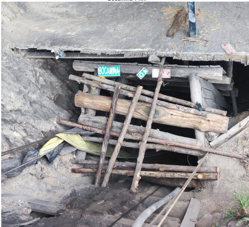
Bocamina 1 NN